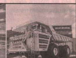
Mining & Construction Equipment