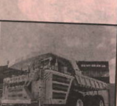
Mining & Construction Equipment