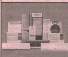
Unitary Cooling Products

Registered Office : Voltas House 'A', Dr. Babasaheb Ambedkar Road, Chinchpokli, Mumbai 400 033, India. Tel. No. : 91 22 66656666 Fax No. : 91 22 66656231 e-mail : shareservices@voltas.com Website : www.voltas.com CIN : L29308MH1954PLC009371