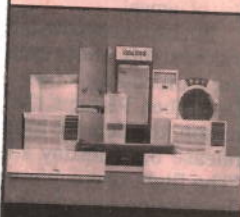
Unitary Cooling Products

Registered Office : Voltas House 'A', Dr. Babasaheb Ambedkar Road, Chinchpokli, Mumbai 400 033, India. Tel. No. : 91 22 66656666 Fax No. : 91 22 66656231 e-mail : shareservices@voltas.com Website : www.voltas.com CIN : L29308MH1954PLC009371