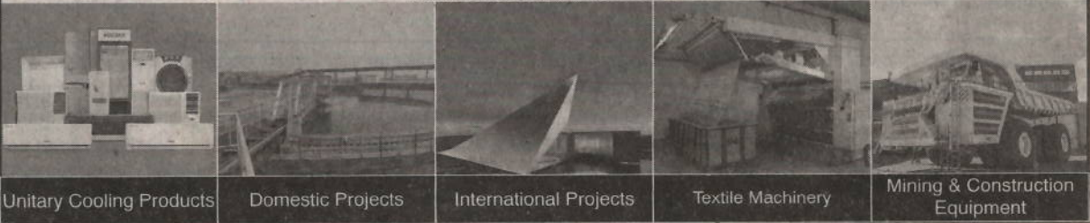
Unitary Cooling Products Domestic Projects International Projects Textile Machinery Mining & Construction Equipment

नोंदणीकृत कार्यालय : व्होल्टास हाऊस, ए. डी. बाबासाहेब आंबेडकर रोड, चिंचपोकळी, मुंबई ४०० ०३३, भारत. दूर. क्र.: ९१ २२ ६६६५६६६६, फॅक्स क्र.: ९१ २२ ६६६५६२३१ ई-मेल : shareservices@voltas.com , वेबसाइट : www.voltas.com सीआयएन : L29308MH1954PLC009371