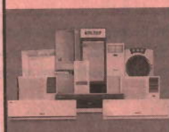
Unitary Cooling Products

Registered Office : Voltas House 'A', Dr. Babasaheb Ambedkar Road, Chinchpokli, Mumbai 400 033, India. Tel. No. : 91 22 66656666 Fax No. : 91 22 66656231 e-mail : shareservices@voltas.com Website : www.voltas.com CIN : L29308MH1954PLC009371