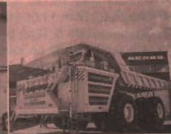
Mining & Construction Equipment