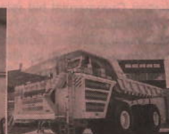
Mining & Construction Equipment